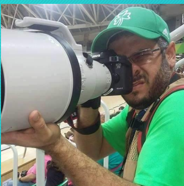
Raphael Oliveira Editor-Chefe, design e Fotógrafo