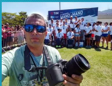
Bruno Lopes Fotógrafo