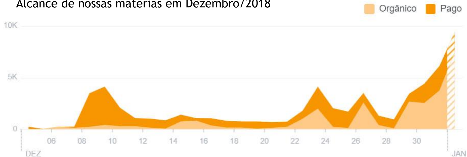
Alcance de nossas matérias em Dezembro/2018